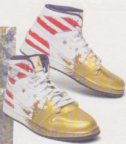
由 DAVE WHITE 設計全球限量二十三對的 AIR JORDAN 1「ALL STAR EDITION」。

有英國 ANDY WARHOL 之稱的 DAVE WHITE 是以球鞋作為創作題材的 SNEAKERHEAD 一位球鞋愛好者，最愛 AIR JORDAN 1。他已經開始以當時的人氣球鞋上作起點，以人色彩的潑墨塗鴉設計很快得到 JORDAN 的青睞，展開了長期的合作。開創了 SNEAKER ART 的先河，以潑墨塗鴉的方式創作球鞋設計，散見世界各地的藝術中心。在 SNEAKERHEAD 為了 DAVE WHITE 早年藝術生涯的創作，成為名的重要基石。直到 2007 年 DAVE WHITE 結束有關於球鞋的潑墨塗鴉，更以他的創作過對於球鞋界的影響延續至今。最近 JORDAN 聯乘合作球鞋，例如在 2012 年以「JORDAN 1 FUTURE」為設計概念推出聯乘版本 AIR JORDAN 1，乃不少粉絲的珍藏。